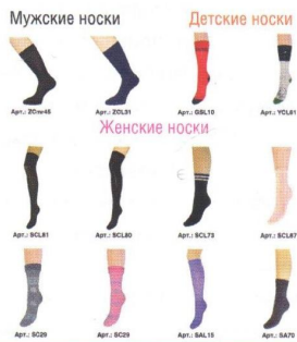
УЛУЧШЕННАЯ ВОЛОКНА ФАБРИКА «ГРАНД» — МЫ ДЕЛАЕМ ВСЕ, ЧТОБЫ ВЫ БЫЛИ ЗДОРОВЫ!

Плоский кетельный шов не создает дискомфорта, не натирая даже нежные ножки малышей. Медицинские носки от чулочно-носочной фабрики «Гранд» рекомендованы женщинам во время беременности и людям, страдающим от сахарного диабета, нарушений сердечно-сосудистой системы, варикозного расширения вен. Их по достоинству оценят и женщины, и мужчины, и дети! Чулочно-носочная фабрика «Гранд» – мы делаем все, чтобы вы были здоровы!