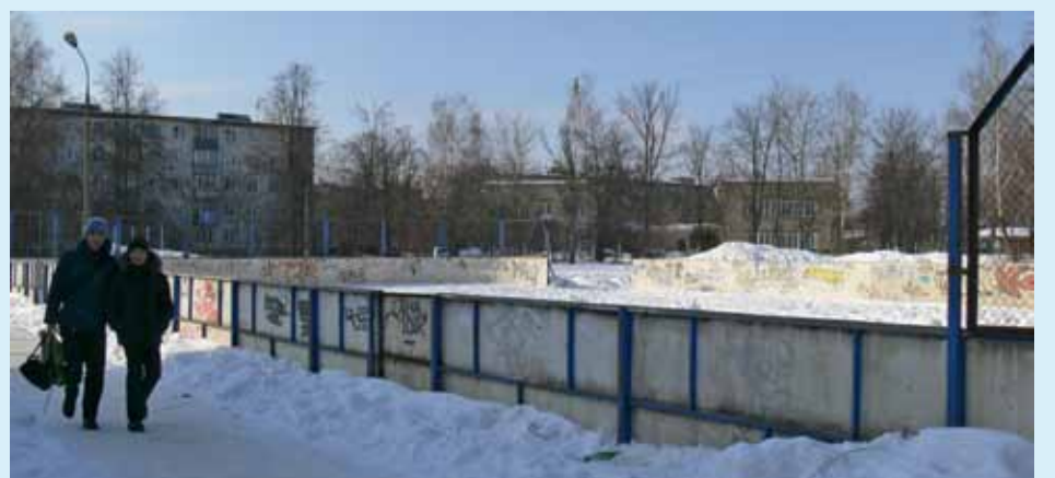
На снимке: открытые спортивные «коробочки» в Подмоскovie не будут эксплуатироваться