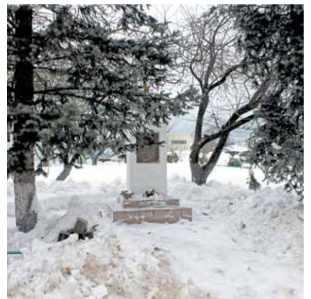
На снимке: памятник солдатам не вернувшимся с фронта