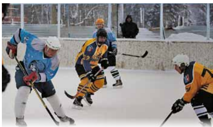
Место встречи – Спартакиада Щёлковского района