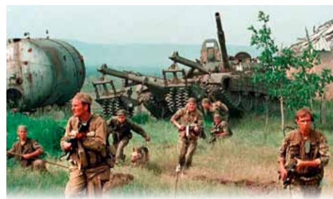
Обнаружить боевиков в ущельях помогла разведка