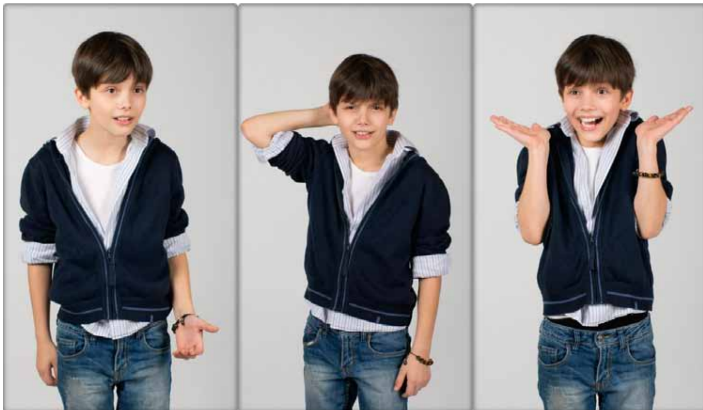
На снимке: актёрское портфолио Артёма Казьмина