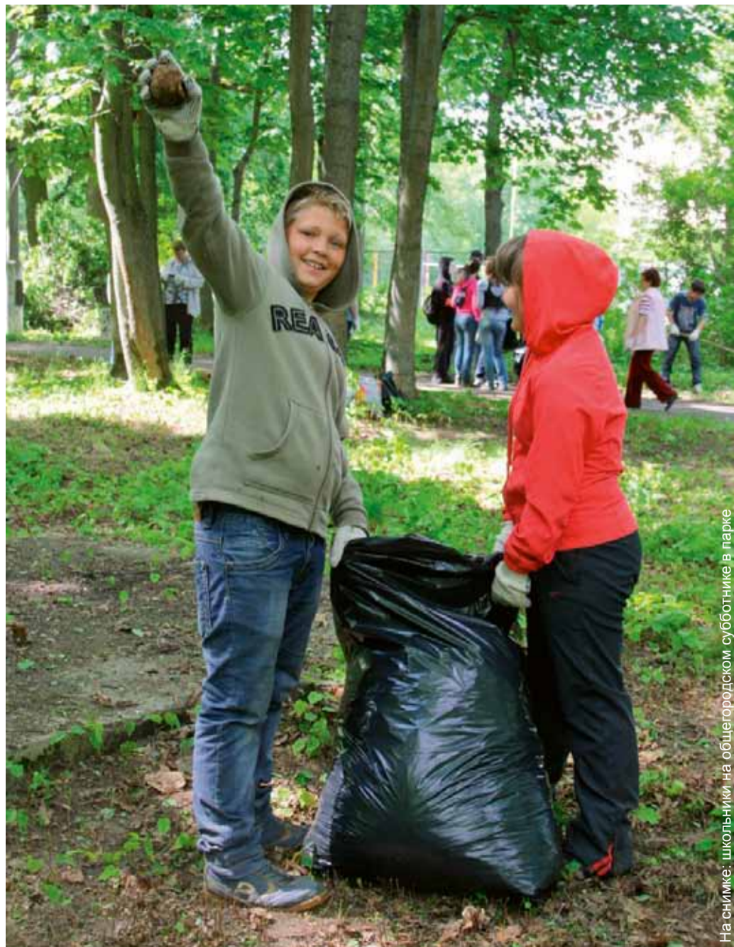
На снимке: школьники на общегородском субботнике в парке

А меня поражает другое: что за тренд – быть революционером? Породили настроения: напасть, уничтожить. Я не только про стройку, а вообще говорю. Почему никто не борется за строительство детского сада, за новую школу, не добивается строительства завода, подвятия с колен промышленности? Неужели нынче («в тренде»), («в оппозиции») модно быть? Вот создали на базе Общественной палаты дискуссионную площадку со всеми уровнями власти: администрацией городского округа, Правительством Московской области, Думой, Администрацией Президента РФ. Почему не использовать? Можно встречаться, выступать, приходиться с инициативами, чем собачиться на каждом углу, чтобы тебя заметили. Мне кажется, надо чаще проводить расширенные заседания, приглашать больше инициативных граждан, способных предлагать альтернативные решения.