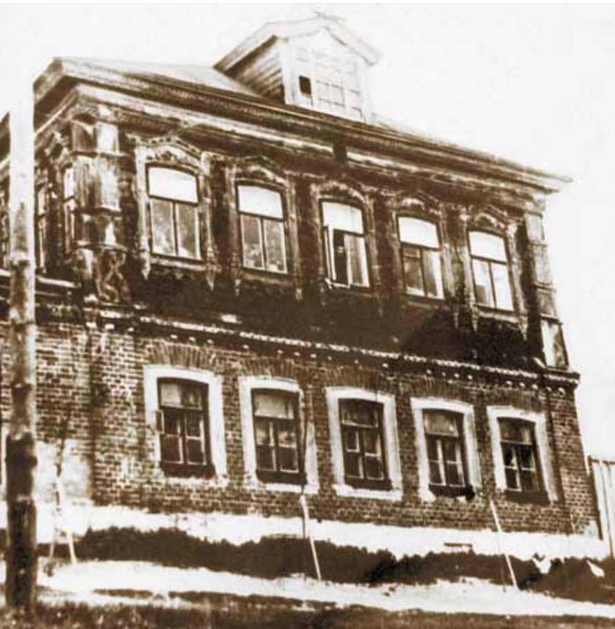
На снимке: дом фабриканта Галкина. 1860г.