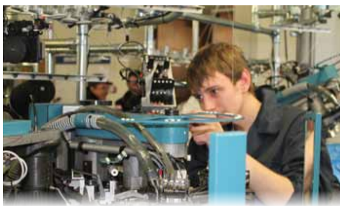
200 рабочих мест создано на новой текстильной фабрике