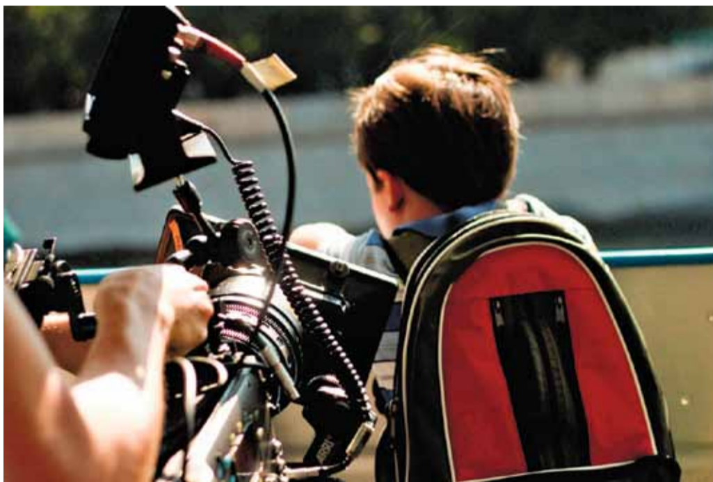
На снимке: съёмки фильма «Здрасьте, приехали!»

А ВЫ ЛЮБИТЕ КИНО? ДА КТО ЖЕ ЕГО НЕ ЛЮБИТ! И ЭТО НЕ УДИВИТЕЛЬНО. РОССИЙСКИЙ КИНЕМАТОГРАФ ПОДАРИЛ НЕМАЛО АКТЁРОВ, НА КОТОРЫХ ХОЧЕТСЯ СМОТРЕТЬ, СОПЕРЕЖИВАТЬ ИХ ГЕРОЯМ. НО СТАТЬ ЗАПОМИНАЮЩИМСЯ – РЕДКИЙ ТАЛАНТ.