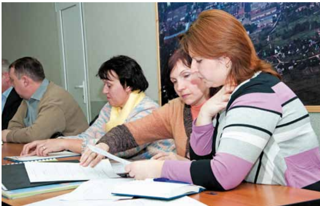
На снимке: специалисты центра по работе с молодёжью «Ступени» (на первом плане)